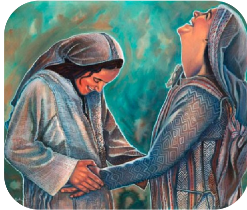
Pour Dieu, rien n'est impossible Lc. 1, 37