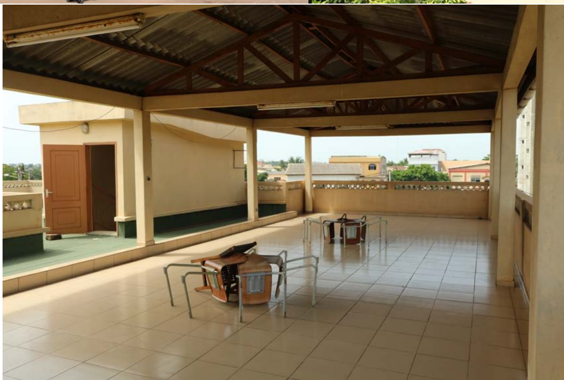
La Curia Provincial MIC, en Lomé

Durante estos días, visitamos el CMS MAC (Centro Médico Social Madre Alfonsa), que las Hnas dirigen en el centro del humilde barrio de Hanoukopé, junto al mercado de carbón de la ciudad. En él, se atienden a un número importante de personas con diversas dolencias, funcionando como un ambulatorio de barrio que cubre gran parte de las necesidades sanitarias de la población, que no puede permitirse un centro privado o un hospital.