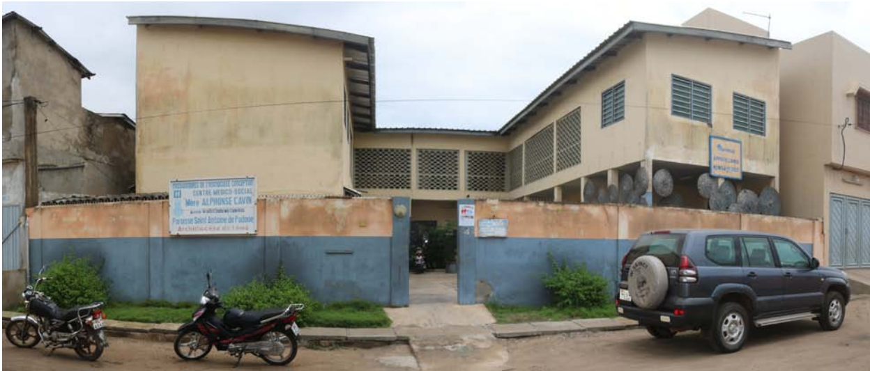
El Centro Médico Social "Madre Alfonsa Cavin de Lomé