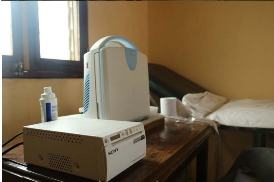
La sala de consultas y el aparato en cuestión