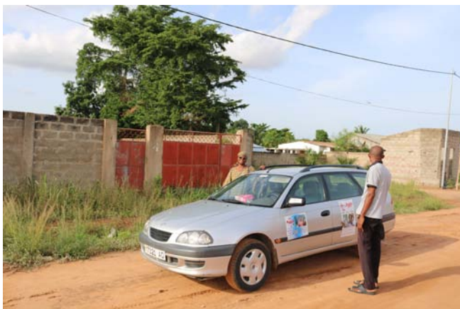
Emplazamiento futuro centro MIC. Norte de Lomé