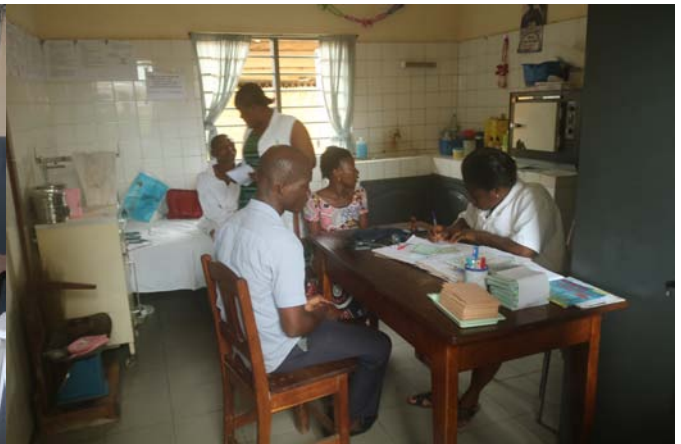
Consulta en el Centro Madre Alfonsa

Además de conocer a fondo el CMS-MAC y de plantear posibles proyectos de mejora desde la FSS, visitamos y evaluamos en Centro de Promoción de la mujer situado dentro de las instalaciones del CMS, y donde se forma a adolescentes con diversa problemática personal desde hace varios años, con el apoyo de la Fundación.