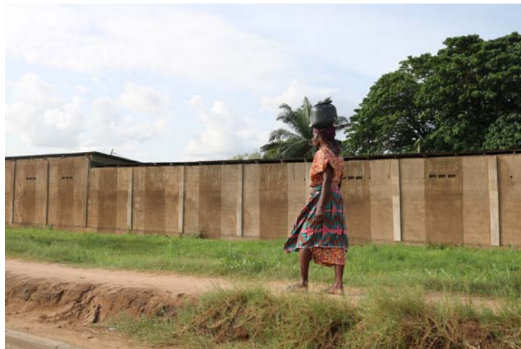
Calles de Lomé