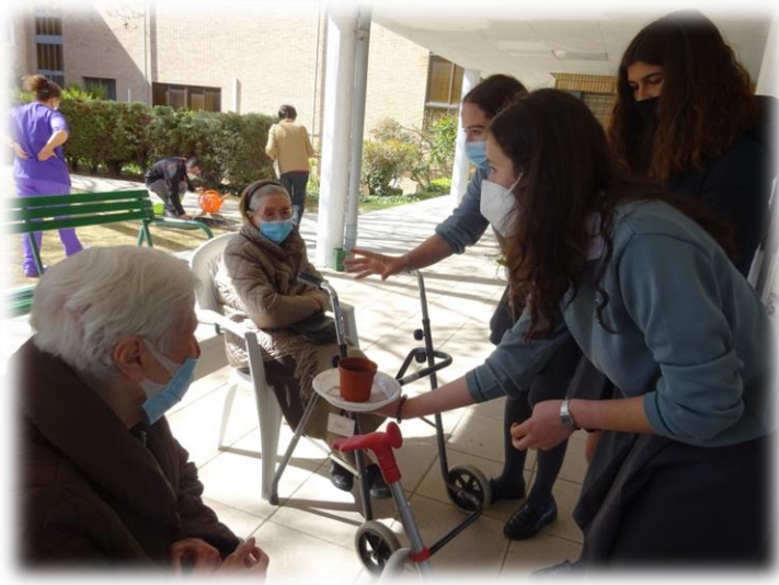
Colegio Alarcón de Pozuelo (proyecto ecológico)