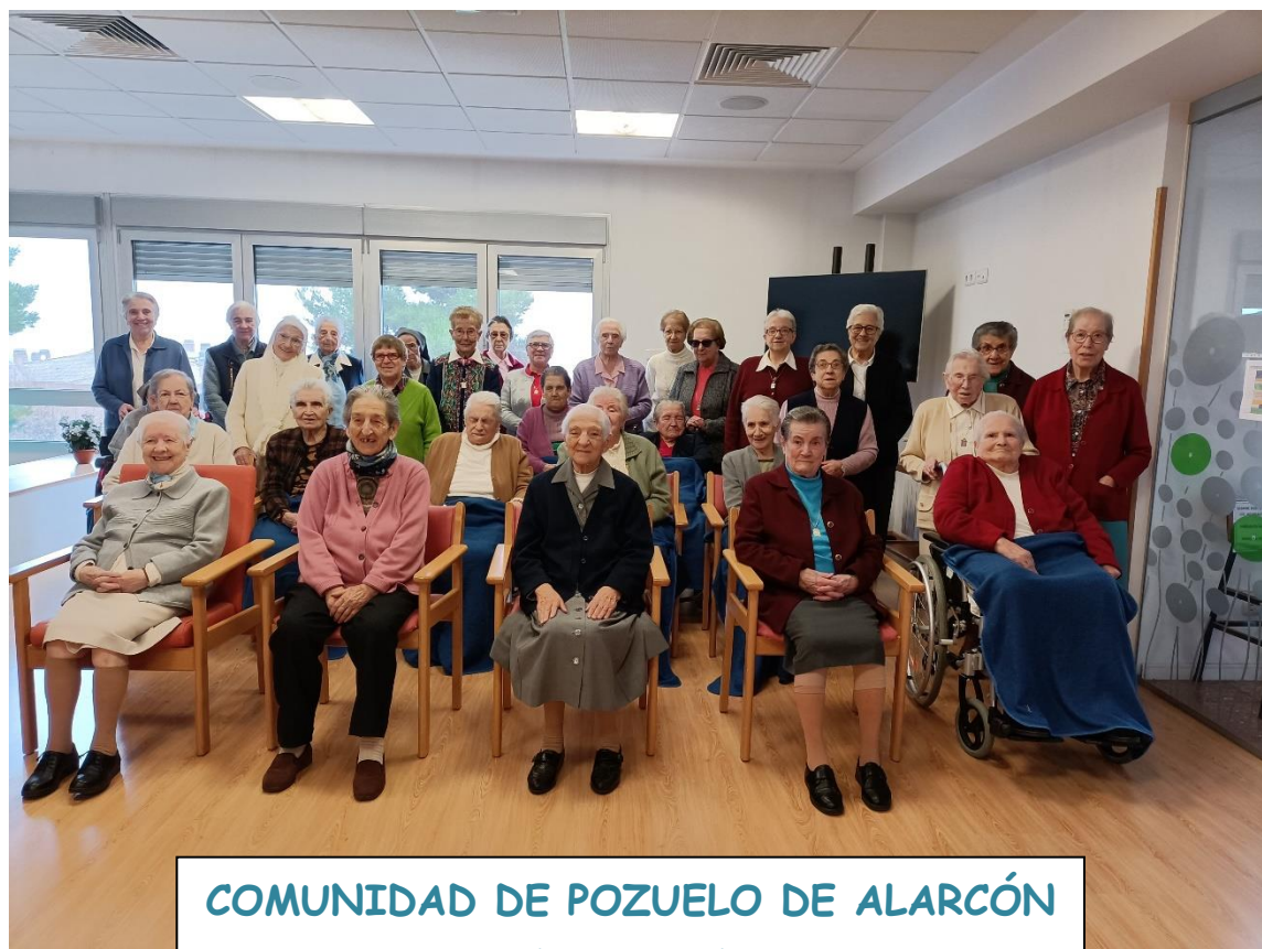
COMUNIDAD DE POZUELO DE ALARCÓN (MADRID)