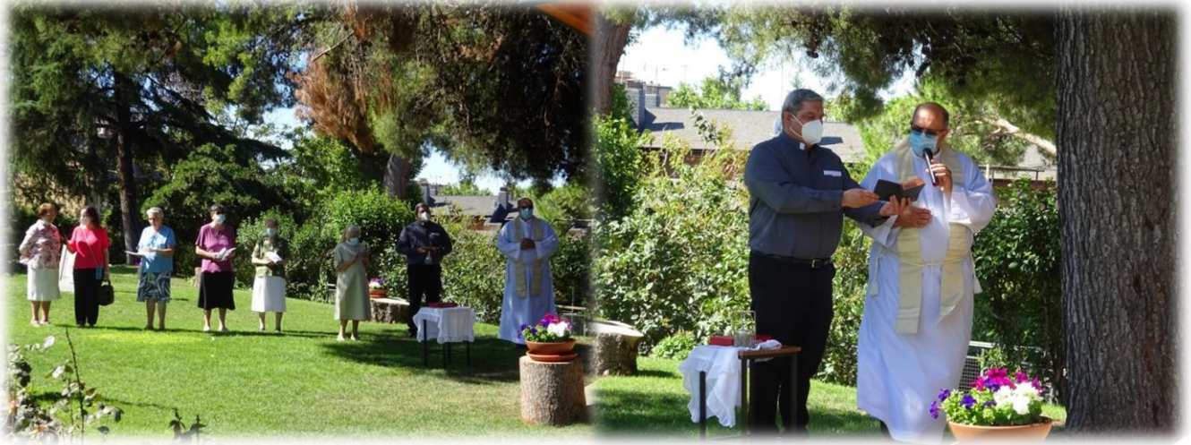
Bendición de la capilla de la Virgen del jardín

En acción de gracias a nuestra Madre Inmaculada se le construyó una capilla en el jardín donde pudiera estar más protegida de las inclemencias del tiempo, siendo su inauguración el 4 de agosto de 2021.