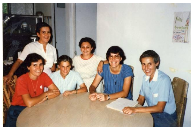
Primeras hermanas en Salina Cruz