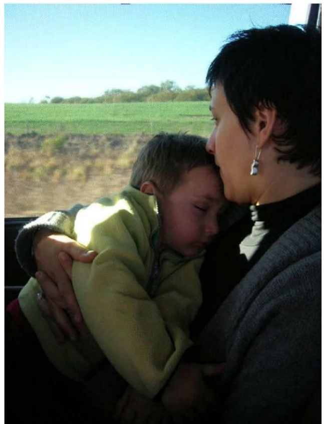
Dulces sueños durante el viaje

Y así, entre visitas y paseos nos pasó casi una semana entera, hasta cerrar de nuevo las valijas y retomar el viaje hacia nuestro destino final. Salimos de Tucumán nuevamente de madrugada, el viernes 23 de julio sobre las 6 de un día muy frío que dejó una fina capa blanca en las cumbres de la pre andina. Esta vez pero, fuimos con dos coches por culpa de las dichas valijas.