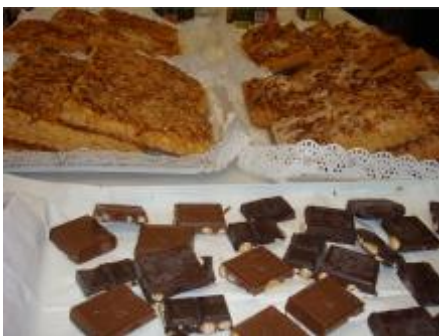
Terminamos el encuentro con la tradicional coca con chocolate.

La Comunidad de Sitges no pudo asistir a esta celebración.